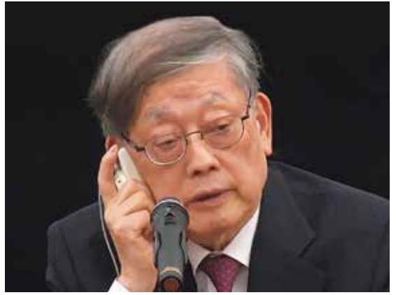
金滉植 （キム・ファンシク） 1948 年生まれ。最高裁判所大法官、監査院長、 国務総理を経て現在は湖巖（ホアム）財団理事長、 三星文化財団理事長。社団法人安重根義士崇慕 会会長。財団法人李承晩記念財団理事長。 著書に「ドイツの力 ドイツの首相たち」「疎通・ 共感そして連帯」等。「日本人 88 人の物語」で は宮沢賢治から大谷翔平まで幅広く取り上げて いる。

ターになろうではないか。 TPP（環太平洋パートナー シップ協定）を超える、 EUレベルの経済連合だ。 すぐには難しいかもしれな いが、日韓2国だけでも EUのようになればすばら しい。