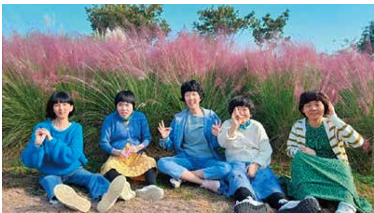
務安回山白蓮池のピンクミュウリーの前で

長く続いた夏の猛暑がいつの間にか姿を消し、そのあとに訪れた花と果実の香りを全身で感じる季節となりました。