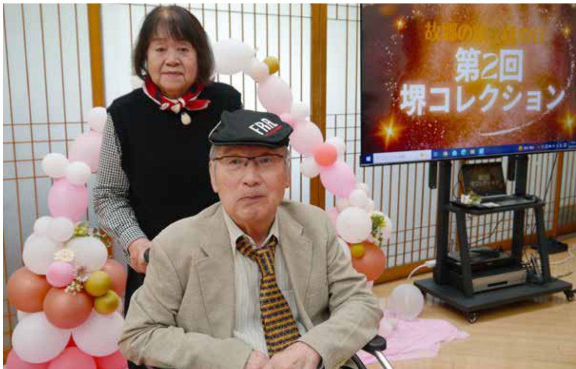
母の日に故郷の家で行われた第2回堺コレクションにて (9ページに記事)